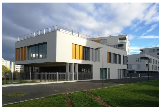
Logements ICF / Bouygues Habitat / Agence PPX - Vue du centre de loisirs depuis l'avenue de la Grande Halle /