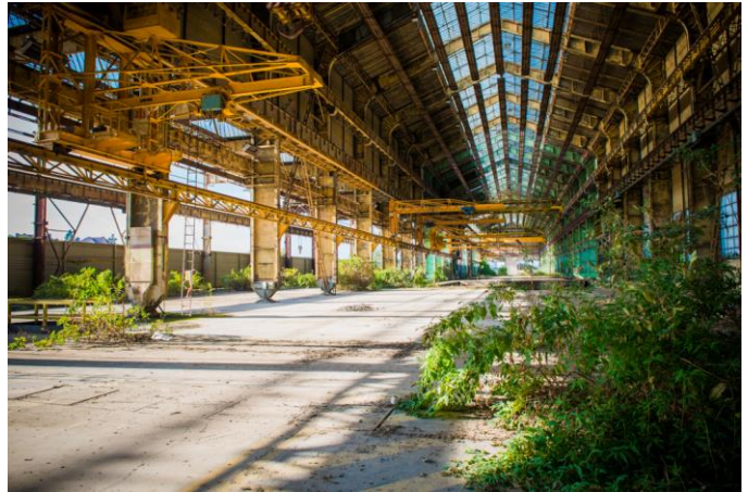
Halle Sulzer