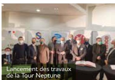
Lancement des travaux de la Tour Neptune

L'ORCOD-IN du Val Fourré passe en phase opérationnelle. Le 6 février, l'EPAMSA était aux côtés de l'EPFIF, de la Préfecture des Yvelines, de la Région Île-de-France, du Département des Yvelines, de la Communauté urbaine GPS&O et de la Ville de