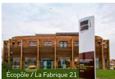
Écopôle / La Fabrique 21

La start-up Mutual Waste s'est installée fin 2020 sur la ZAC Écopôle. Spécialisée dans le recyclage des déchets, cette entreprise de l'économie sociale et solidaire transforme ces déchets et crée des produits réinjectés dans l'économie locale.