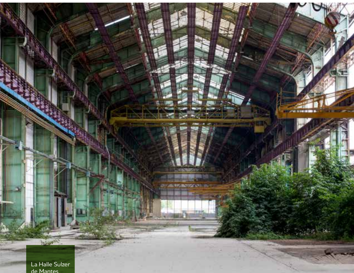
La Halle Sulzer de Mantes Université

MANTES UNIVERSITÉ : DES PERSPECTIVES QUI S’AFFIRMENT – CARRIÈRES CENTRALITÉ : UNE DYNAMIQUE TRÈS SOUTENUE