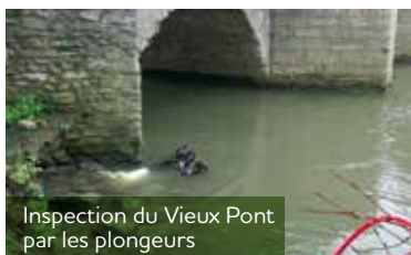
Inspection du Vieux Pont par les plongeurs

L'EPAMSA, mandaté par le Syndicat mixte Seine Ouest (SMSO) et la Communauté urbaine GPS&O, poursuit la conduite du projet de restauration du Vieux Pont et la pose d'une seconde passerelle dans la continuité de la